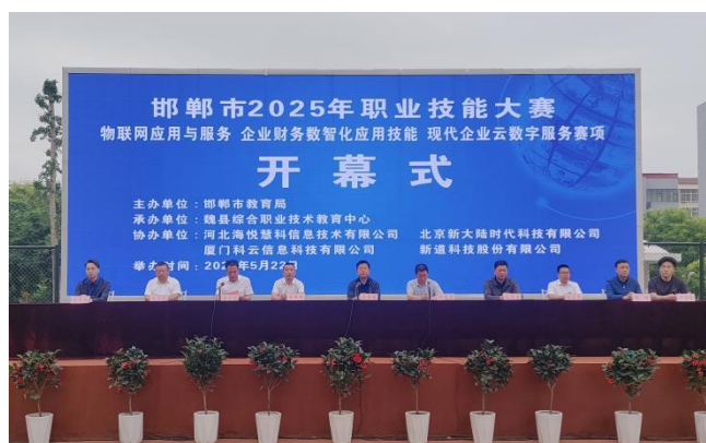
图11：邯郸市2025年职业技能大赛开幕式

2.1.7技能大赛。学校高度重视学生技能大赛工作，积极组织师生参加国家、省、市、县各级各类专业技能大赛，成立了技能大赛工作专班，建立了技能大赛激励机制，组建了参赛项目团队，制定了团队训练计划，选派专业带头人作为团队指导教师，对各团队定期进行指导训练，让学生把赛项内容融入日常的实习实训课堂，赛教融合，赛训融合，赛证融合，以赛促教，以赛促学，以赛促改，以赛促建，技能大赛成绩斐然，硕果累累，教师业务更加专业，学生技能更加精湛，进一步提升了教育教学质量和学校办学水平。2025年，学校共参加省级及以上技能大赛16场，承办市级技能大赛3场，参加市级技能大赛28场，举办校级技能大赛33场，成果丰硕。学生共获奖184人次，其中，国家级获奖3人次、省级获奖44人次、市级获奖137人次；教师共获奖121人次，其中，国家级获奖3人次、省级获奖29人次、市级获奖89人次。同时，学校还成功承办了邯郸市2025年职业技能大赛3个赛项比赛，荣获优秀承办单位和优秀组织奖，圆满完成了校级比赛。