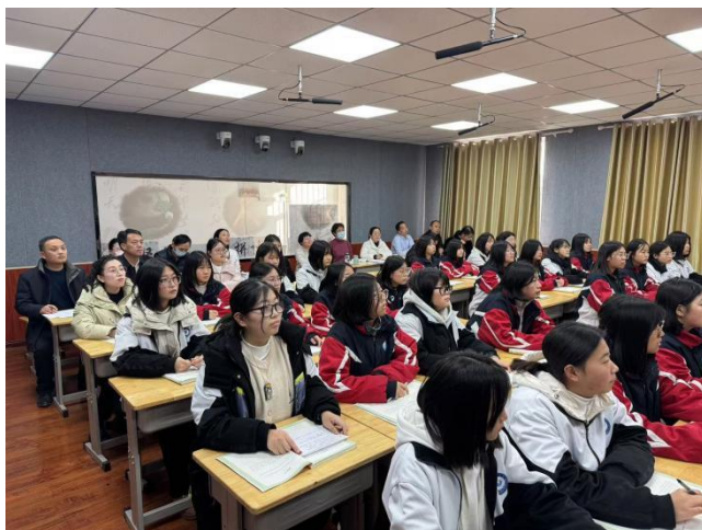
图14：青年教师教学比赛