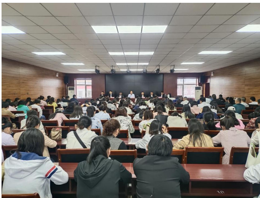
图 4 培训交流会

9、导师成效评价制。通过学生、家长的反馈以及学生的成长情况等方面对导师工作进行评价，激励导师不断改进工作。对优秀导师在全校进行大力宣传，充分发挥优秀导师的引领示范作用。