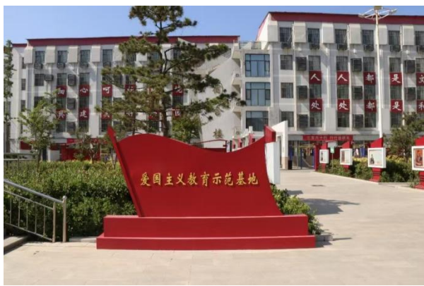
图22：邯郸市爱国主义教育示范基地

雄模范人物为主要内容的爱国主义教育示范基地，每天组织班级进行宣誓，鼓舞了学生士气。目前，学校已形成了处处有文化，时时有文化，文化在身边，文化在心中的具有鲜明职教特色的校园文化。同时，学校还组建了足球、篮球、排球、羽毛球、乒乓球、太极拳、田径、轮滑、啦啦操、陆地冰壶等10个体育兴趣小组，在市县各项体育赛事中屡创佳绩。组织开展了国旗队、音乐、美术、书法、朗诵等社团活动。