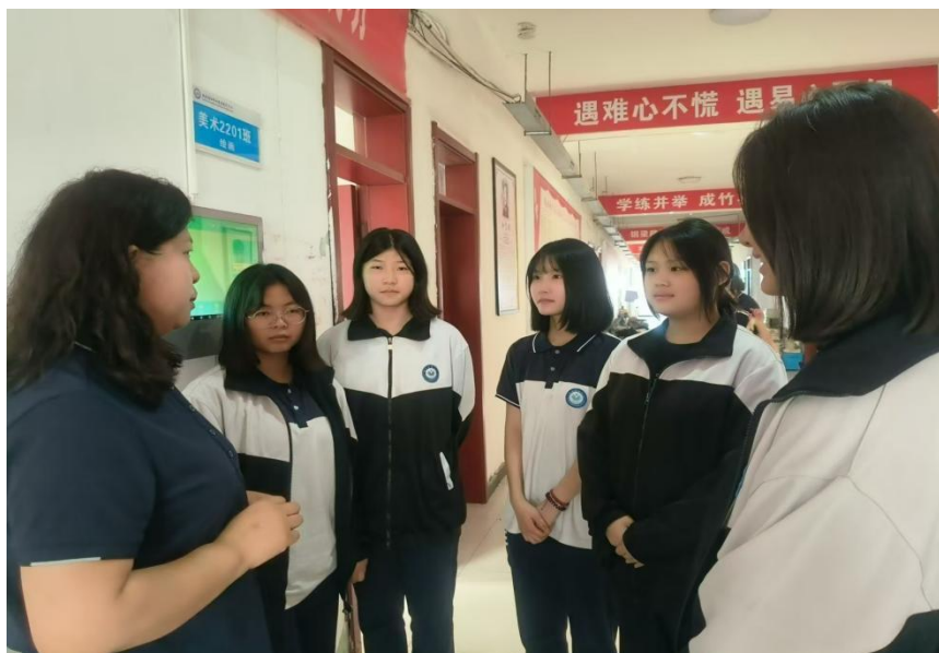
图 3 导师和学生沟通交流

约定固定的沟通时间，如每周一次的面谈，或不定期的线上、线下交流。此外，还通过电话、家访等方式与学生及家长保持密切联系。