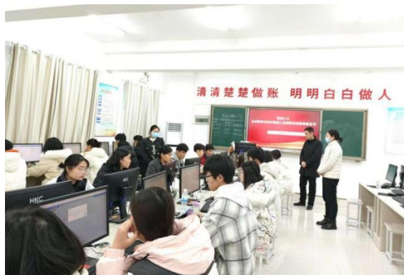
图7：“1+X”企业财务与会计机器人应用职业技能等级证书考试

题、农业无人机常识及操作技术、计算机应用技能、消防安全、心理健康等各级各类培训10期，共培训社会人员1500人次，培训在校生5000余人次。