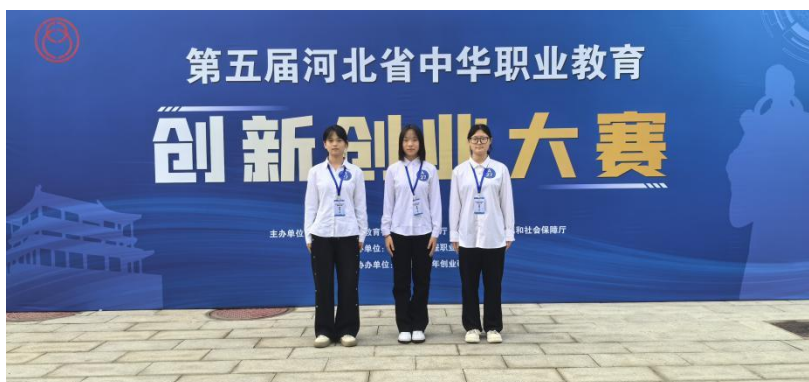
图10: 第五届河北省中华职业教育创新创业大赛获奖

2.1.6 创新创业。学校现有邯郸市第三批教师教学创新团队1个，为会计事务专业团队。2025年，在第五届河北省中华职业教育创新创业大赛中，学校派出的代表队，经过层层选拔、激烈比拼，最终精心打磨的参赛作品《智能防埋头盔》脱颖而出，荣获团体三等奖。