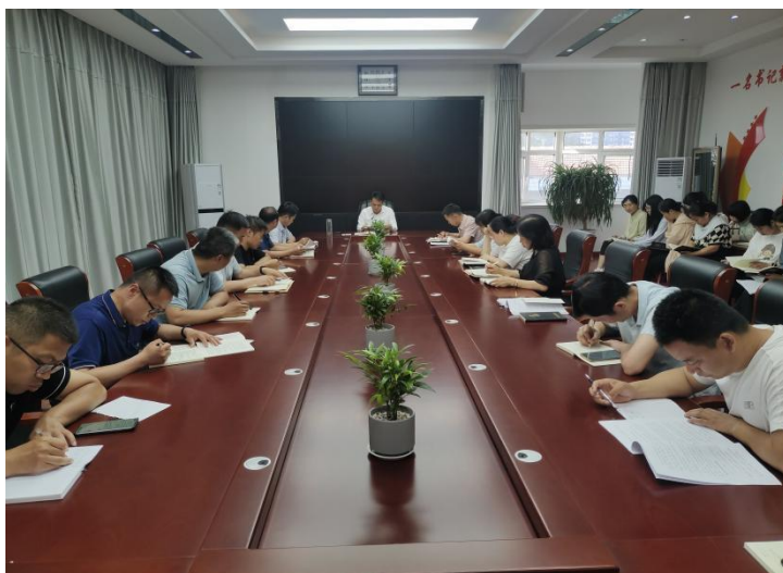
图 1 专题调度会

1、定期调度推进制。学校高度重视全员导师制，党总支书记每周一主持召开领导班子和中层干部会，专题调度全员导师制落实情况，研究部署下步推进措施，每月主持召开全体教职工会，对全员导师制进行再总结再部署。