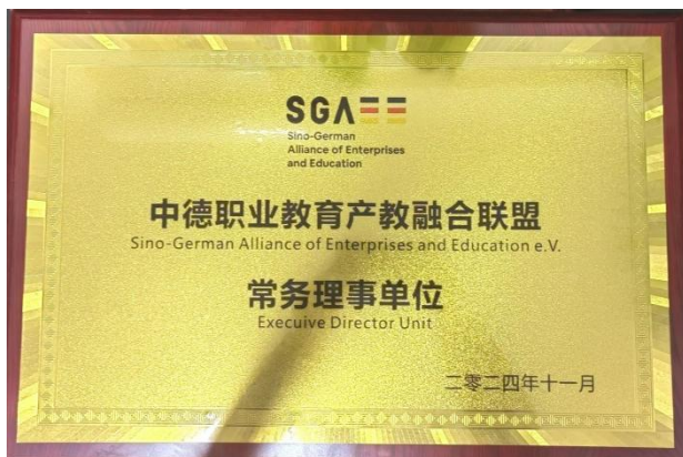
图24：中德职业教育产教融合联盟中方理事会常务理事单位

2025年，在中德职业教育产教融合联盟中方理事第四次会议上，学校被授予中德职业教育产教融合联盟中方理事会常务理事单位，远海中欧文旅产业学院暨"文旅+智造"产教融合实践中心建设单位，并加入博鳌职业教育发展大会组委会，并成功签约中德智能制造产教融合合作项目。