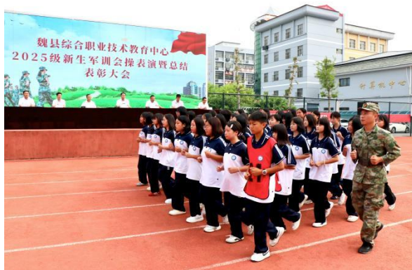
图6: 新生军训会操表演暨总结表彰大会

通过让学生接受良好的德育教育，进一步加强学生的爱国主义、集体主义、社会主义教育，启迪学生，引领学生，教化学生，全面推进了学生德育建设。