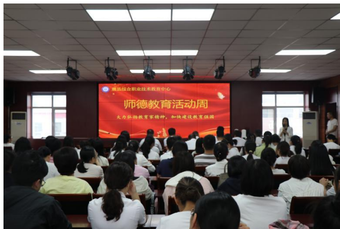
图16: 师德师风教育活动周

兵1人、市级师德标兵10人、县级师德标兵12人、校级师德标兵65人。在此基础上，组织师德标兵事迹演讲，辐射带动全校教师，大大激发了广大教师看齐先进、争做标杆的热情，全校教师师德水平大幅提高。