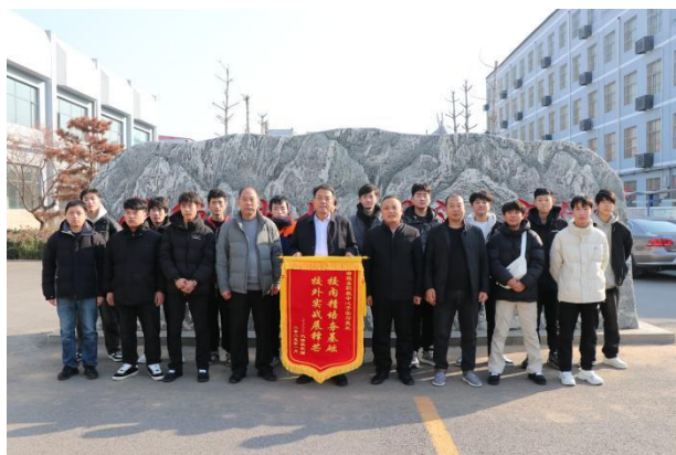
图9: 汽车运用与维修专业实习学生给母校赠送锦旗

2.1.5 升学情况。2025年，学校高考参考人数80人，本科上线34人，其中，对口高考参考22人，本科上线10人，美术统考参考58人，上线24人。对口高考本科上线率为45%，较2024年上升22个百分点。高职单招再创新高，总参考942人，上线622人，上线率为66%，录取570人，录取率为92%，再次彰显了低分入校、高分升学的优势，实现了低入高出的好成绩。