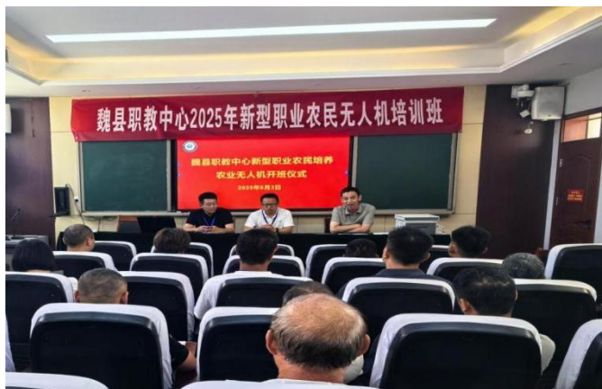
图19：开展新型职业农民无人机技能培训

业增效、农民增收、农村发展，为全面推进乡村振兴、加快农业农村现代化、推进农村生态文明和农业可持续发展提供了人力资源保障和人才支撑。