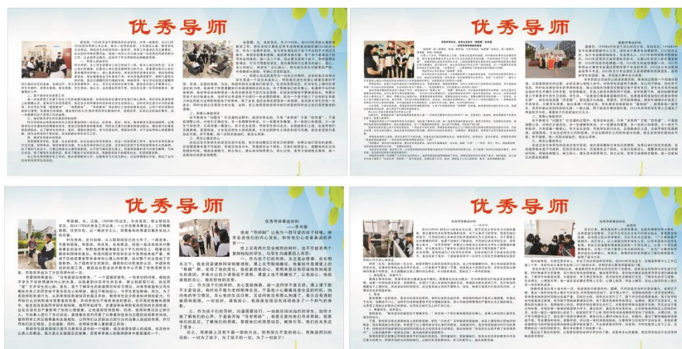
图 5 优秀导师事迹宣传

9、导师成效评价制。通过学生、家长的反馈以及学生的成长情况等方面对导师工作进行评价，激励导师不断改进工作。对优秀导师在全校进行大力宣传，充分发挥优秀导师的引领示范作用。