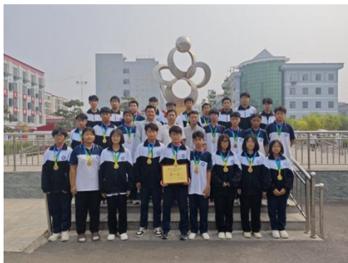
图8：魏县2024年冰雪运动会获奖

学校积极组织师生参加国家、省、市各级各类专业技能大赛，喜报连连，成果丰硕。2024年，学生共获奖199人次，其中，省级获奖80人次、市级获奖119人次，教师共获奖140人次，其中，国家级获奖2人次、省级获奖59人次、市级获奖79人次。先后荣获河北省职业院校技能大赛数字网络布线设计与实施赛项一等奖、会计事务专业四个赛项均获三等奖；获得一带一路暨金砖国家技能发展与技术创新大赛三等奖等。同时，学校还成功承办了邯郸市中职学校学生技能大赛3个赛项比赛，荣获优秀承办单位和9个赛项优秀组织奖。