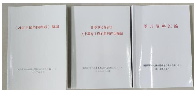
图17：集中整顿学习资料

利通过了邯郸市教师教学创新复核验收，积极组织教师参加了国培、省培、市培等各级各类培训，2025年，共参加国培48人次，省培266人次，市培34人次。学校制定培训手册，参训教师每天按要求填写培训日志表，回校后，将自己所学知识进行整理，对在校教师进行二次培训，及时将学习成果分享，促进全校教师的共同进步。