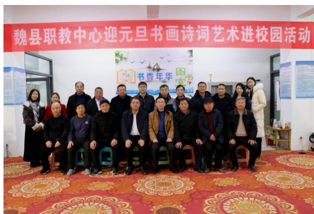
图21：书画诗词成语进校园活动

4.1 大师工作室传承文化。2025年，学校邀请了县内外20余名书画诗词名家到校开展书画诗词成语进校园活动，书画家们现场挥毫泼墨，一幅幅字画气韵生动、栩栩如生，吸引了在场师生啧啧赞叹，书画诗词名家们共创作了40余副书画作品、30余首诗词对联，精妙的笔墨，散发着艺术的芳香，浸润着师生的心田，播下了美好高雅的艺术种子。