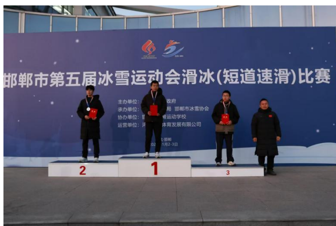
图12：邯郸市第五届冰雪运动会获奖

队，团结协作，沉着应战，奋勇争先，经过激烈角逐，参赛师生全部获奖，共荣获银牌5枚、铜牌1枚，还获得第四名3个，第六名2个，第七名2个，第八名2个。在魏县2025年新年登高暨行走大运河健步走活动中，学校代表队在比赛中奋勇争先，发挥出色，经过激烈角逐，分别荣获男子组冠军、亚军和第五、第六、第七、第八、第九、第十名，女子组第二、第四、第八名的骄人成绩，男子组几乎包揽前十名。