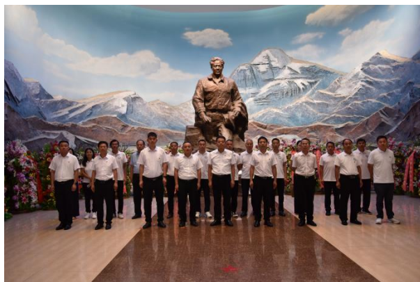
图3：党员干部到山东省聊城市孔繁森同志纪念馆开展学习教育

坚持党建引领发展，深入学习习近平总书记关于作风建设的系列重要讲话、中央八项规定精神及其实施细则，以及省市县关于作风建设的一系列文件和会议精神。校领导班子发挥示范引领作用，组织理论学习中心组集中学习4次，组织全体党员集中学习4次，全体教职工集中学习2次，举办读书班2次，讲党课3次。组织部分党员干部到山东省聊城市孔繁森同志纪念馆开展学习教育，加强警示教育，确保了学习教育走深走实，取得成效。