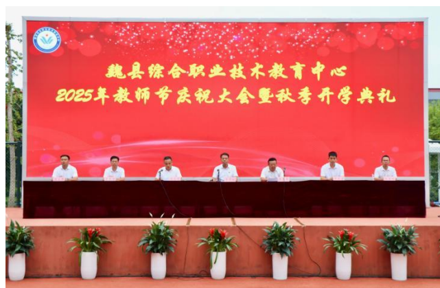
图15：教师节庆祝大会暨秋季开学典礼

学校先后组织召开了校级月考分析会、教研工作会、教师节庆祝大会暨秋季开学典礼、青年教师工作会、新教师岗前培训会，组织开展了优质课比赛、青年教师教学比赛、成语接龙比赛、学科竞赛、“双师型”教师评选、师德标兵评选、骨干教师评选等活动。对接社会需求，结合发展实际，学校新申请开设了旅游服务与管理、康养休闲旅游服务、智慧健康养老服务、运动训练四个专业。